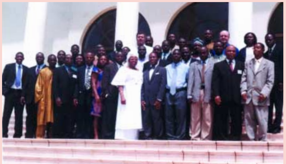
WAIFEM FdF, mai 2003, Accra, Ghana

Ils ont plus généralement recommandé que des manuels et des modèles soient donnés aux participants 2 semaines avant l'atelier, afin de permettre aux participants très intéressés de préparer des données et des idées et de s'assurer que les participants appropriés soient nommés. Ils ont également exigé davantage de formation concernant Debt-Pro® lors d'un atelier régional séparé.