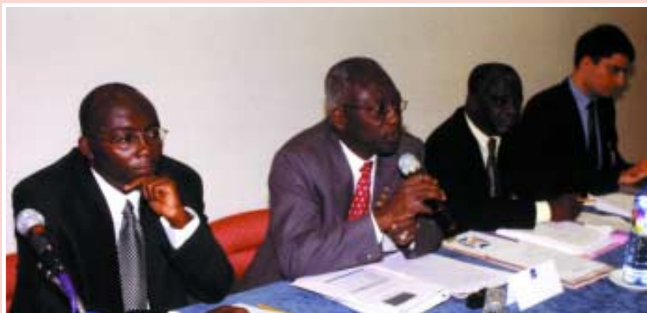
Clôture de l'atelier de dissémination du Ghana, 14 mai 2003

L'Ouganda a obtenu un taux de réponse impressionnant de 56% malgré un registre non fiable, grâce à un meilleur travail sur le terrain et des campagnes de prise de conscience basées sur les médias. L'équipe cible les réponses de 75% des entreprises représentant 95% des investissements, poursuit de larges compagnies ne répondant pas au sondage et vérifie les données, et prévoit de disséminer ses résultats lors du troisième trimestre.