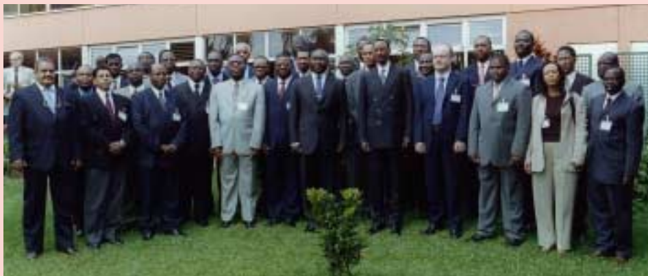
Son Excellence Paul Kagame, président de la République du Rwanda, ouvrant la 8ème Réunion des ministres des finances des PPTE

Dans la Déclaration de Kigali, les ministres ont réitéré leur appréciation des mesures de la communauté internationale pour mettre en œuvre PPTE II, pour mobiliser un financement supplémentaire pour le développement, pour permettre aux pays de mettre en œuvre les stratégies de réduction de la pauvreté et pour renforcer la capacité du gouvernement des PPTE à gérer le financement pour le développement et les programmes de réduction de la pauvreté. Ils ont une fois de plus insisté sur leur engagement à élaborer et à mettre en place des stratégies de réduction de la pauvreté, et de faire au mieux de leur capacité pour dépenser l'allègement de la dette et de nouveaux financements de manière productive et transparente sur la réduction de la pauvreté. Ils ont néanmoins soulevé d'importants problèmes communs nécessitant une attention d'urgence si les PPTE sont censés atteindre leurs Objectifs de développement pour le millénaire (ODM) d'ici 2015.