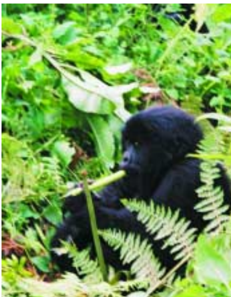
Avril 2003 : c'est l'heure de déjeuner pour la plus jeune recrue du PRC PPTE !

Le conseiller en gestion de la dette du WAIFEM, Sam Omoruyi, s'est rendu auprès de DRI à Londres du 7 au 16 avril. Ce